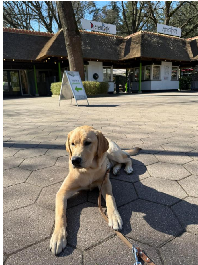
Even braaf 'af'...