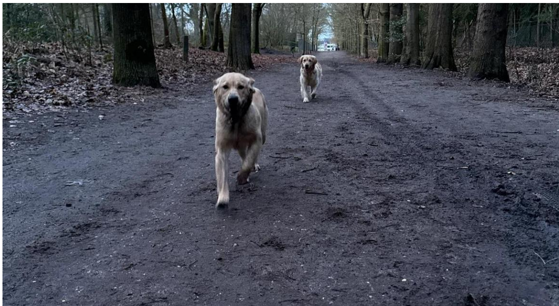
En dan is het tijd om lekker door het bos te rennen!