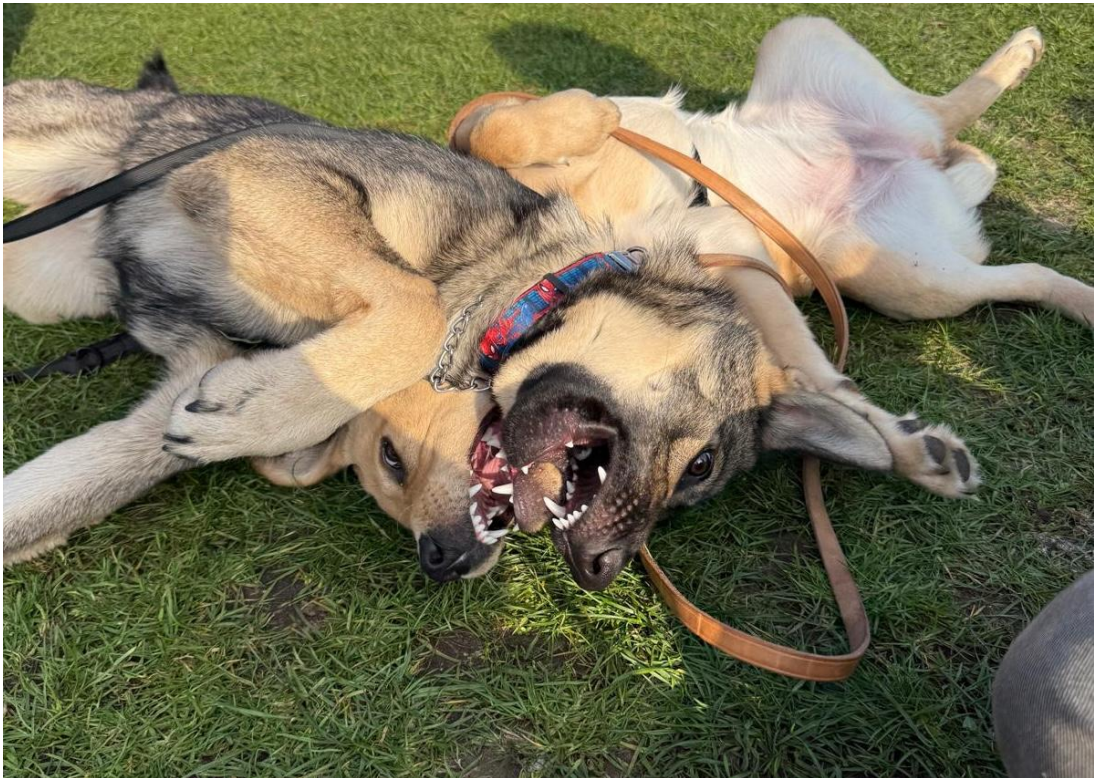
Zoekplaatje: Joska in stoeistand