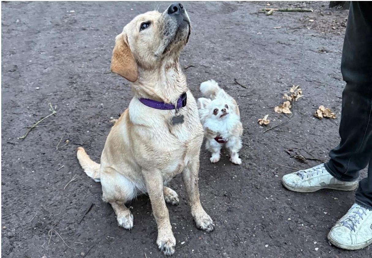
De kleine chihuahua en Joska zijn inmiddels dikke vrienden

‘Ze wordt ook steeds wat stoerder en loopt zelf naar andere honden toe, al blijft ze wel onderdanig.’