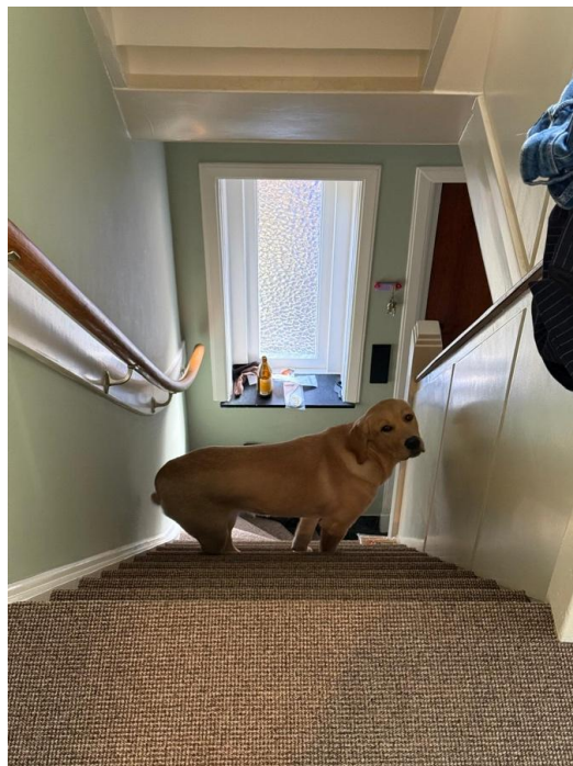
Midden op de trap, ze durft zelf niet naar beneden...

'Joska heeft ook ontdekt dat de bank erg lekker ligt. Ze weet dat het niet mag, maar soms vinden we haar er toch op.'