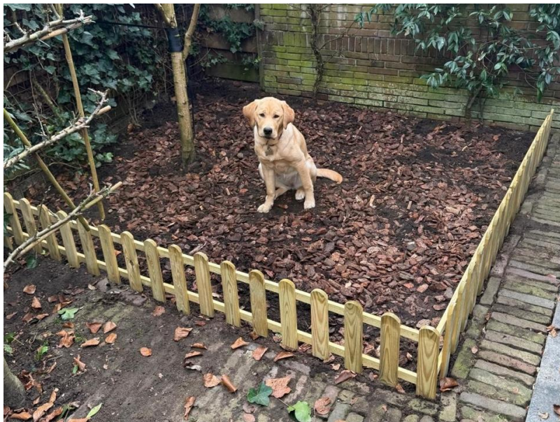
Hoeft ze niet meer in de bench, zoekt ze alsnog begrenzing op...