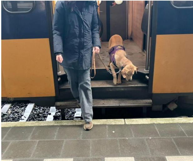
Kennismaken met treinen

‘Onder begeleiding van KNGF hebben we twee maanden geleden voor het eerst met de trein geoefend. Hierbij richtten we ons vooral op het wennen aan de drukte op het station, de liften en het in- en uitstappen.’