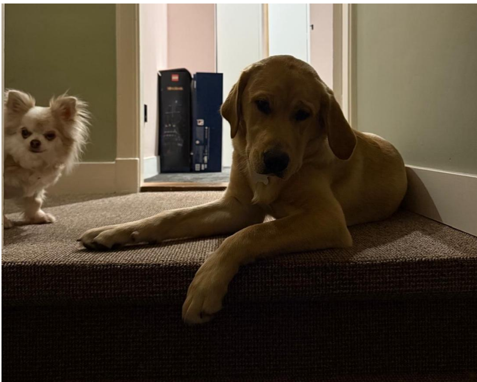
Bovenaan de trap... en toen?