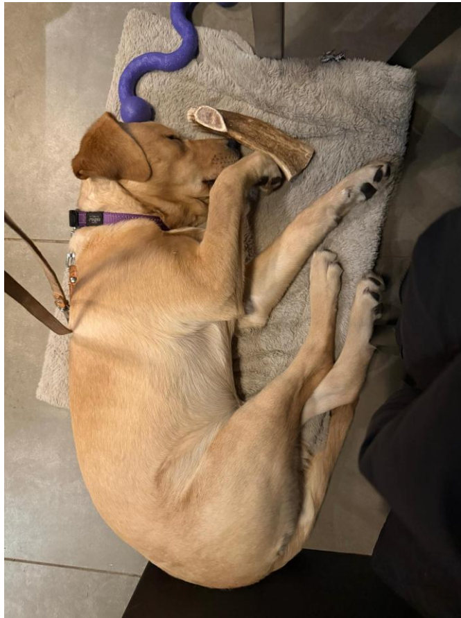
In diepe slaap tijdens een terrastraining