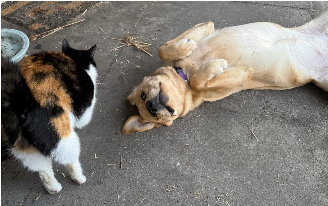
Van de kat is ze inmiddels ook niet meer onder de indruk